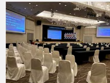
ソーシャルディスタンスを確保した配席