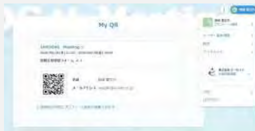
事前登録制によるQRコード受付