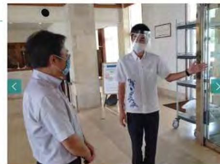
リゾート内での取り組み