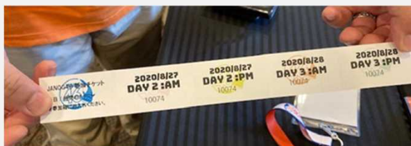
参加者登録No付チケット制を導入 (参加プログラムへ提出する仕組)