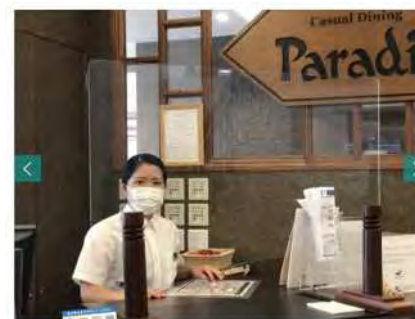
レストランでの取り組み