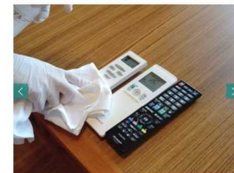
客室での取り組み