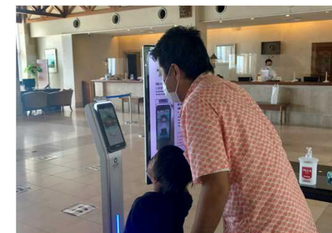
チェックイン・チェックアウト時の取り組み