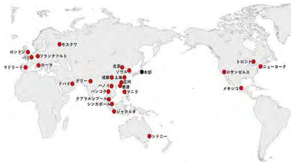
日本政府観光局のネットワーク