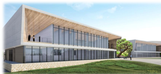
第2・3インキュベータ施設 (完成イメージ)