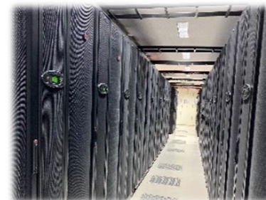
データセンター (イメージ)