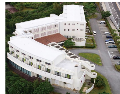
(シーサイドハウス)