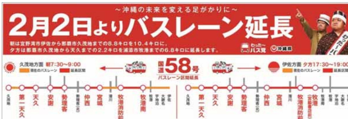
図 バスレーン延長区間（平成 27 年 2 月 2 日より実施）