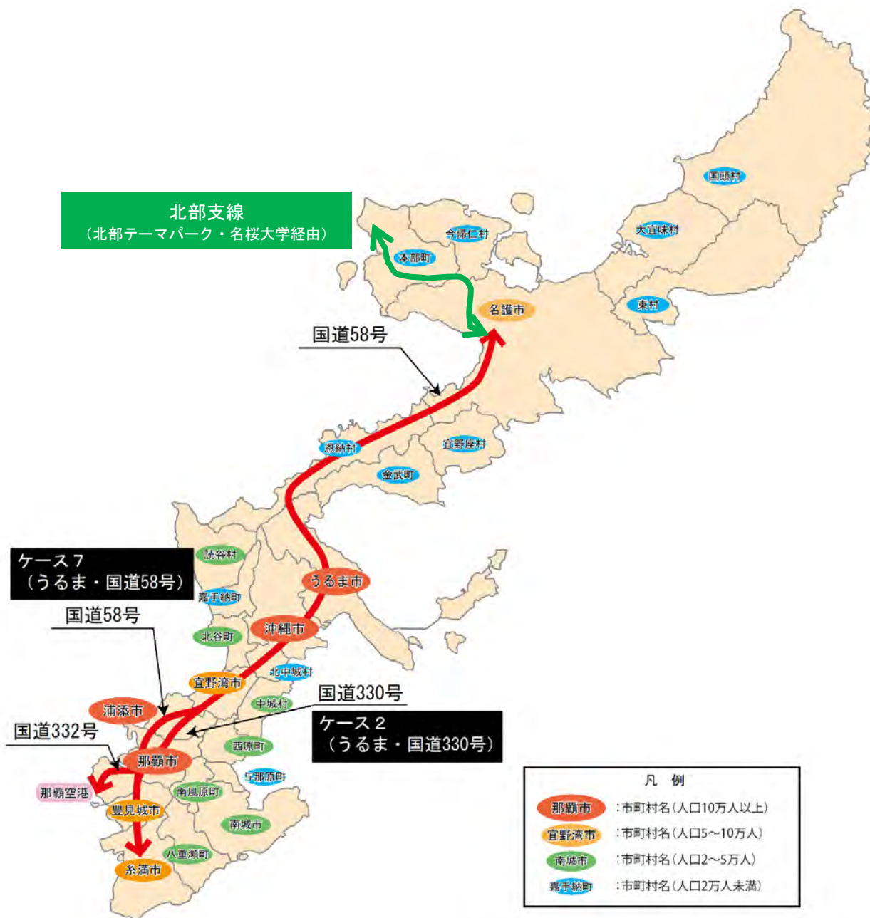
図 検討ルートの概念図

需要予測値や収支採算性の更新の影響等を確認するに当たって、過年度調査で主な検討ルートとして扱われてきたケース2及びケース7を基にB/Cの試算を行った。また、北部支線を考慮したケースについてもB/Cの試算を行った。