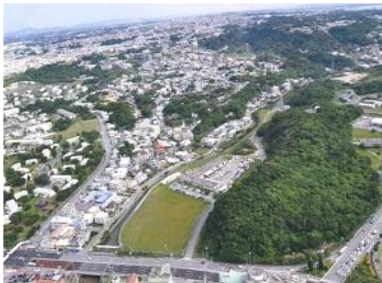
「北谷城(グスク)」