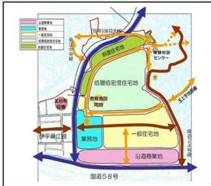
「キャンプ桑江南側地区土地利用計画」(平成21年度) ※本計画は案策であり、今後変更があり得る