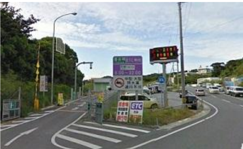
喜舎場スマートIC現況