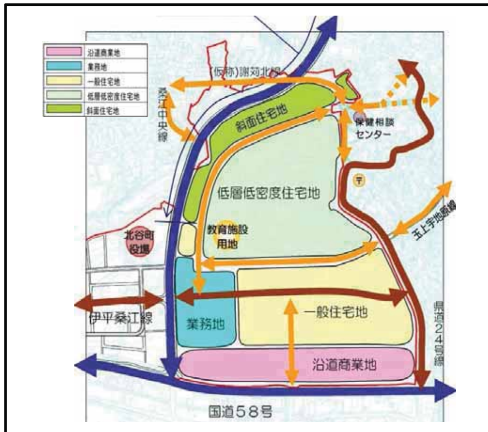
「キャンプ桑江南側地区土地利用計画」(平成21年度) ※本計画は素案であり、今後変更があり得る