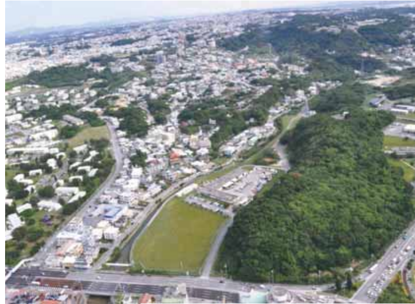
「北谷城(グスク)」