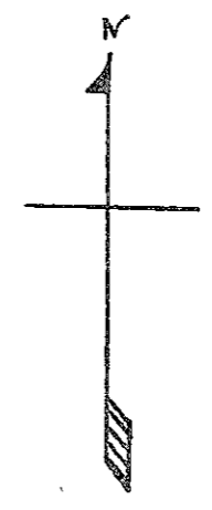
第七中隊配備要圖