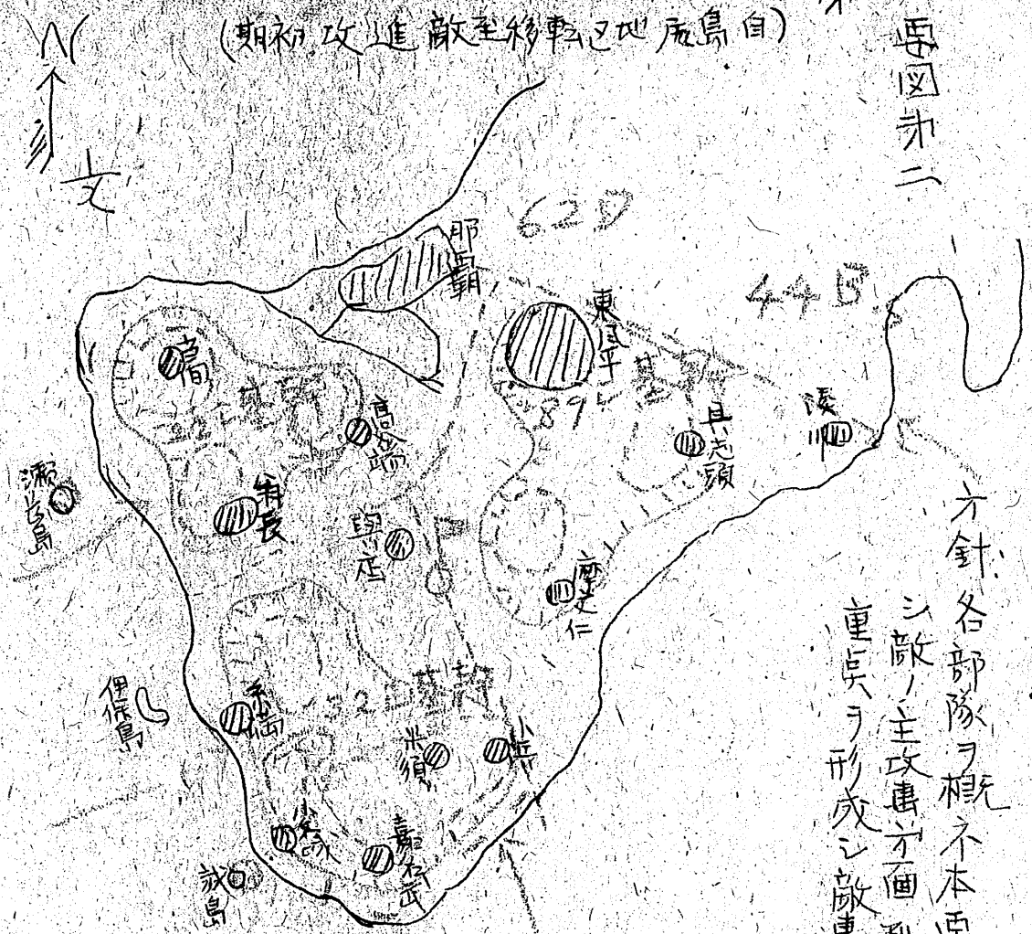
第一十二師団島尻地区防衛配備要図 (自島尻地区轉移至敵進攻初期)

十、九師団ノ實施セル築城進度ハ師団継承ノ結果ニ徴スルニ約三十パーセントヲ加テ 此部所謂トタル岩地帯ニテ作業比較的容易ナルニ及シ南部ハ硬岩地帯ニ シテ多量ノ爆薬ヲ使用スル非ザルニテ作業極大ニ困難ノ地帯ナリニモ拘ハラス爆 薬僅クニテ作業遅クトシ進捗セズ加之敵ノ進攻速カナリシヲ以テ築城 完了中途ニテ敵ヲ迎フルノ止ムナキニ至リタル憾ムテモ尚余リアリト云フ