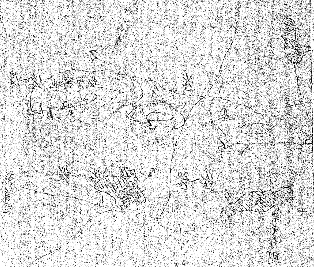
前日西武上原ノ戦

戦況ノ詳細ニ関シテハ別紙ニ記シテ置キ 此ノ圖ハ戰況ノ大體ヲ示スルニシテ 實情ノ細部ニ至リテハ別紙ニ參照スルコトナリ