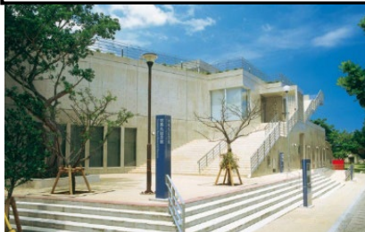
対馬丸記念館 外観