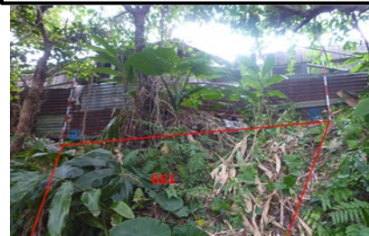
所有者不明土地の例(傾斜地)