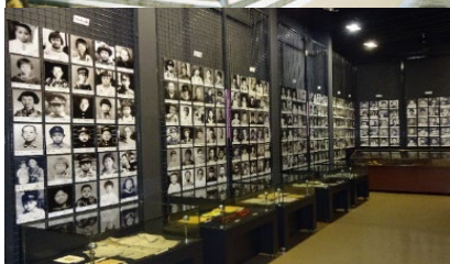
対馬丸記念館 展示室