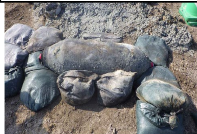
那覇空港滑走路において発見された250kg爆弾（令和2年4月）