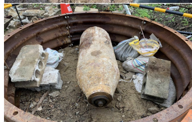
西原町において発見された250kg爆弾（令和4年1月）