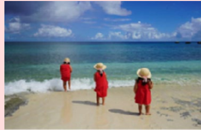
フォトコンテストシーズン7 最優秀作品 『順番に入ります』