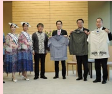
岸田総理・松野官房長官・西銘沖縄担当大臣へのかりゆしウェア贈呈式