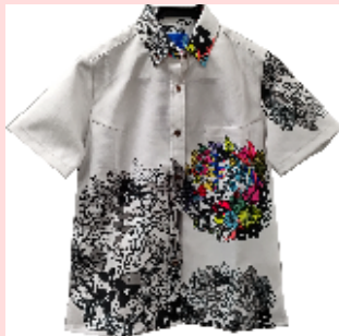
かりゆしデザインコンテスト2022最優秀作品 『OKINAWAN PARADICE』