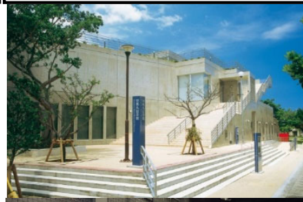
対馬丸記念館 外観