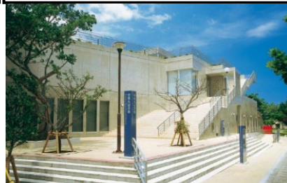
対馬丸記念館 外観