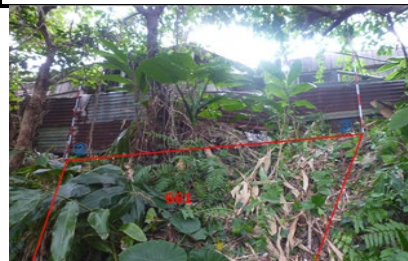
所有者不明土地の例(傾斜地)