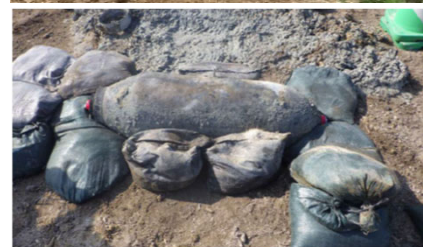
那覇空港滑走路において発見された250kg爆弾(令和2年4月)