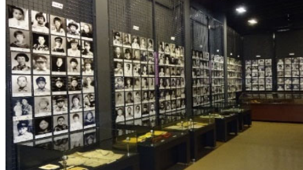
対馬丸記念館 展示室