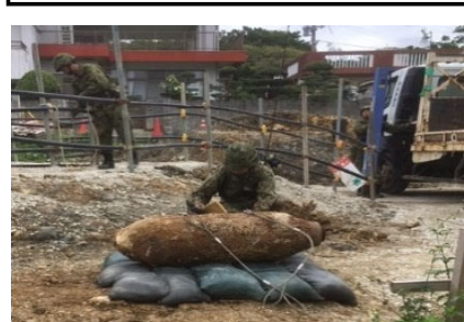
糸満市において発見された250kg爆弾(令和元年6月)

沖縄復帰特措法附則の「政府は…速やかにその実態について調査を行い、その結果に基づいて必要な措置を講ずる」の規定を受け、全国的な議論も踏まえた調査検討事業を実施している。