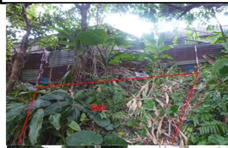
所有者不明土地の例(傾斜地)