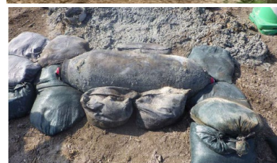
那覇空港滑走路において発見された250kg爆弾(令和2年4月)