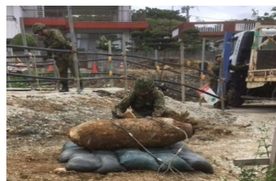
糸満市において発見された250kg爆弾(令和元年6月)

沖縄復帰特措法附則の「政府は…速やかにその実態について調査を行い、その結果に基づいて必要な措置を講ずる」の規定を受け、全国的な議論も踏まえた調査検討事業を実施している。