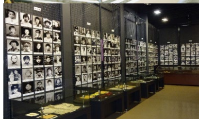
対馬丸記念館 展示室