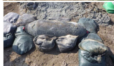
那覇空港滑走路において 発見された250kg爆弾 (令和2年4月)