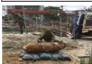
糸満市において発見された 250kg爆弾(令和元年6月)

沖縄復帰特措法附則の「政府は…速やかにその実態について調査を行い、その結果に基づいて必要な措置を講ずる」の規定を受け、全国的な議論も踏まえた調査検討事業を実施している。