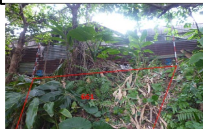
所有者不明土地の例 (傾斜地)