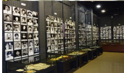
対馬丸記念館 展示室