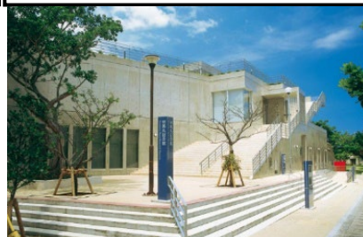
対馬丸記念館 外観