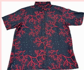
かりゆしデザインコンテスト2024最優秀作品 『赤サンゴ』