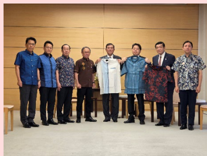
総理・官房長官・沖縄担当大臣への かりゆしウェア贈呈式(官邸)