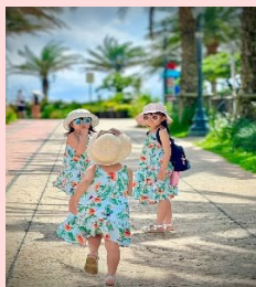
フォトコンテストシーズン9 最優秀作品 『お姉ちゃん待って』