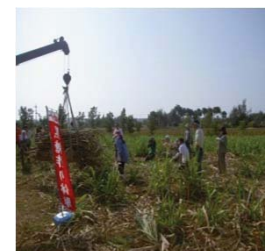
援農活動(さとうきび) (南大東島)