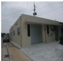
カジキ等の水産加工施設 (与那国島 平成19年度～20年度)