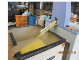
もちきび選別機 (波照間島 平成19年度)