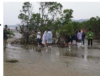
西表島での体験学習(壺屋小学校)