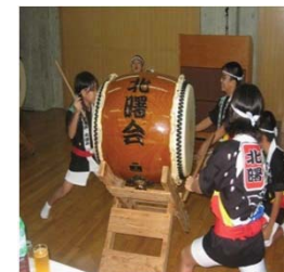
大東太鼓体験 (北大東島)