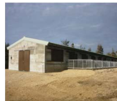
山羊舎及び加工施設 (多良間島 平成19年度～20年度)