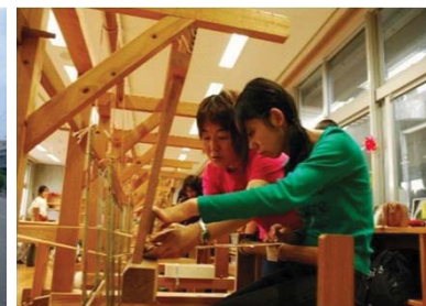
久米島で整備された伝統工芸体験施設(左)及び久米島紬織り体験プログラムの模様(右)