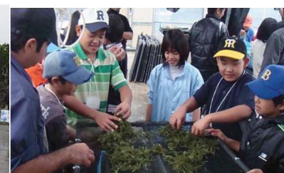
伊是名島での体験学習 (城東小学校)