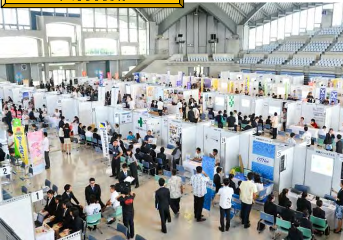
新規学卒者等総合就職支援事業（H24～33） 若年者の雇用状況改善のための取組