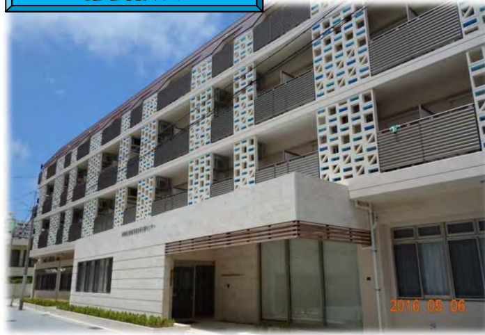
沖縄県立離島児童生徒支援センターの整備事業 （H24～27）H28.1月開所