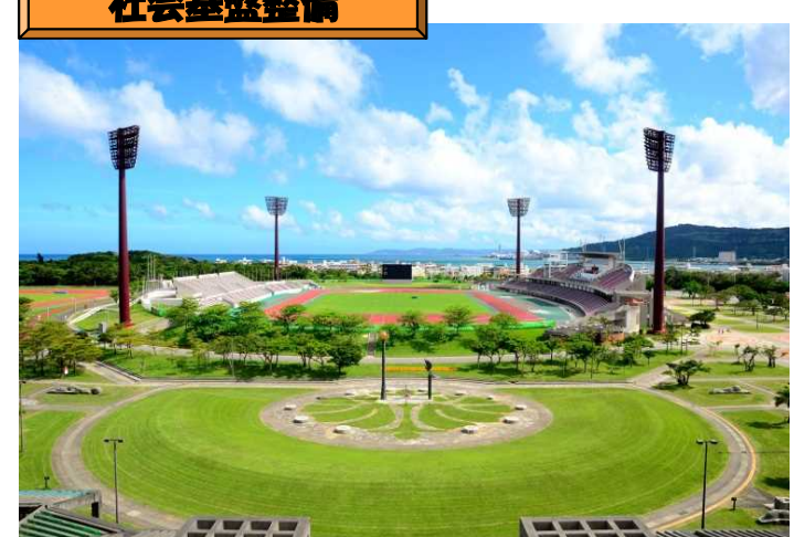
沖縄県総合運動公園フットサルスタジアム事業 （H24～27）H27.3月供用開始