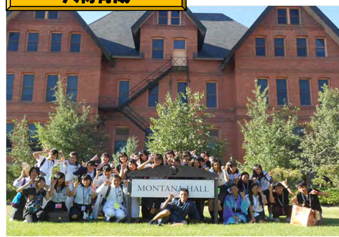
グローバル・リーダー育成海外短期研修事業（H24～33） アメリカ等諸外国へ781名を派遣（H27迄累積）