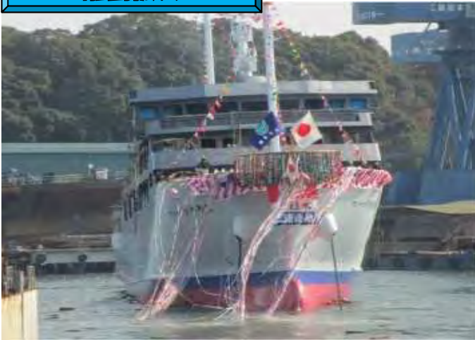
離島航路運航安定化支援事業（H24～33） 伊平屋航路他 フェリーいへやⅢ（H26.4月就航）