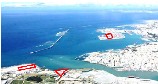
那覇市内の国際物流拠点産業集積地域 (線で囲まれた部分。左から那覇空港地区、那覇地区、那覇港地区)