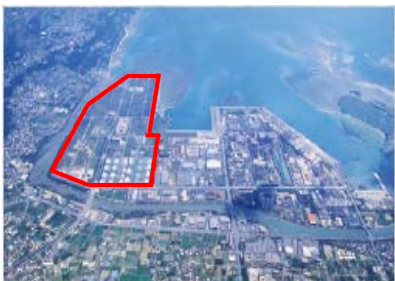
国際物流拠点産業集積地域中城湾港新港地区 (線で囲まれた部分)