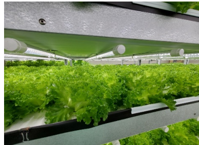
南大東村ほか3市村