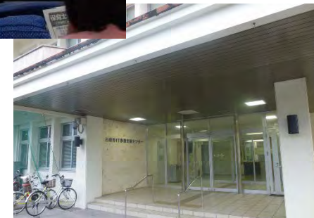
石垣市IT事業支援センター（同施設内で授業を実施）