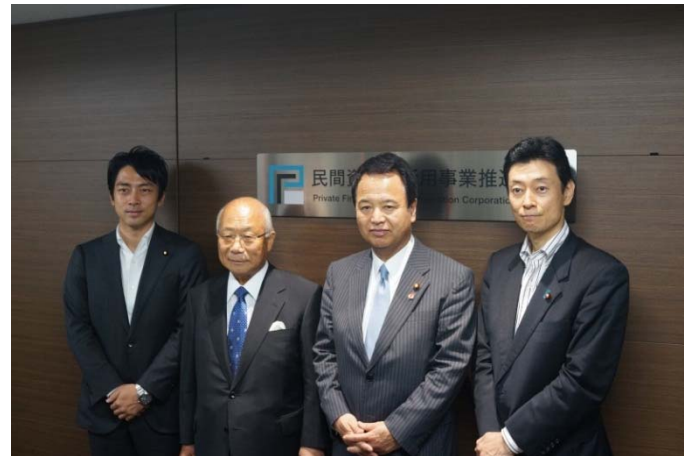
除幕式の様子(平成25年10月11日)