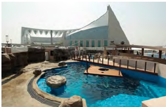
海の中道海浜公園海洋生態科学館