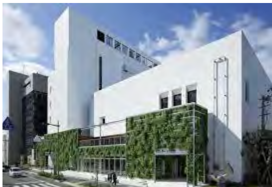
徳島県青少年センター(とくぎんトモニプラザ)