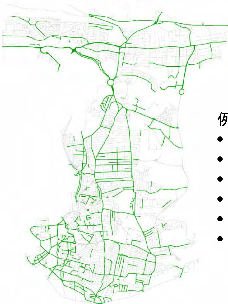
Completed Road Works