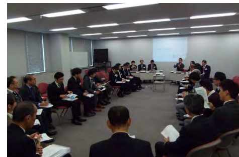
滋賀大学等 (平成28年度支援)