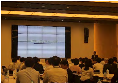
いしかわPPP/PFI地域プラットフォーム (羽咋駅周辺整備事業)