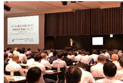
(国の施策に関する講演)