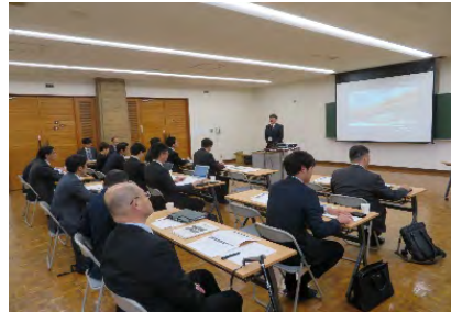
広島県PPP/PFI地域連携プラットフォーム (広島市三滝少年自然の家・ グリーンスポーツセンター改修事業)