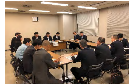
(個別案件のサウンディング状況) 川崎市PPPプラットフォーム