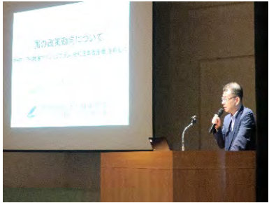
静岡市PPP/PFI地域プラットフォーム (国の政策動向について)