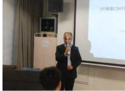
ぎふPPP/PFI推進フォーラム (PFI事業におけるファイナンスの考え方)