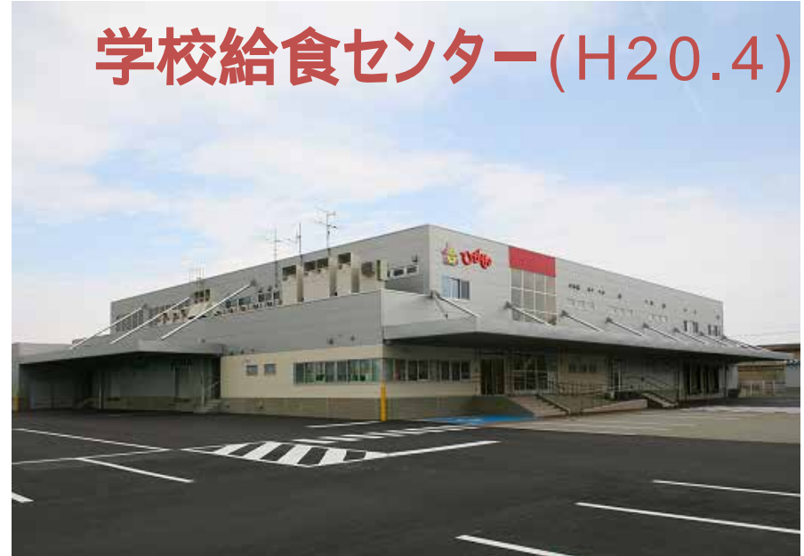
学校給食センター (H20.4)