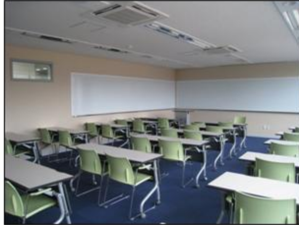
- 地上3層 講義室