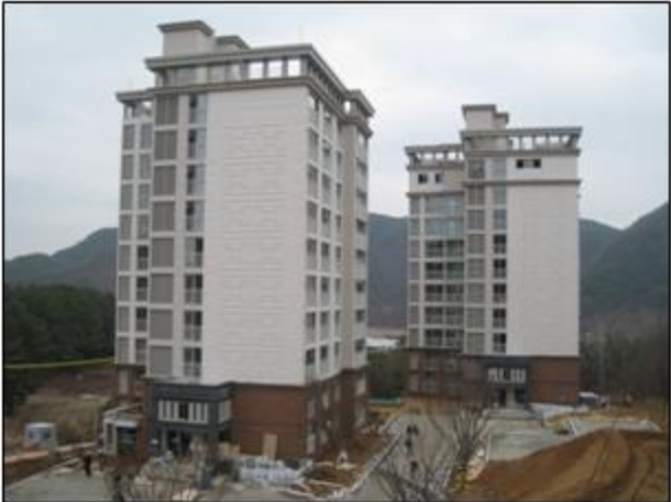
- 教授아파트 全景