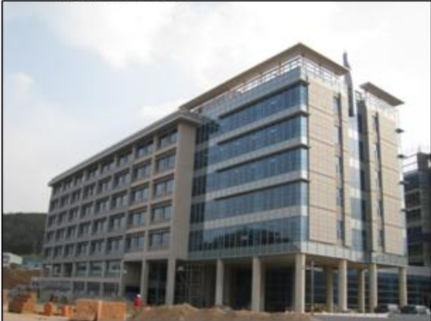
- 自然科学館 全景