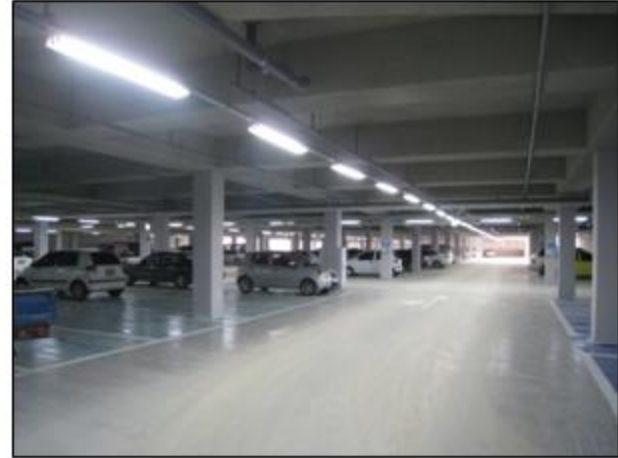
- 地下1層 駐車場