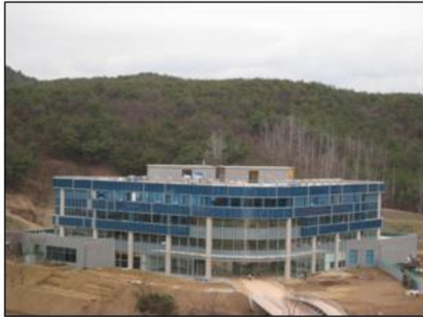
- 學術情報館 全景