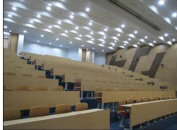
- 220人 講義室