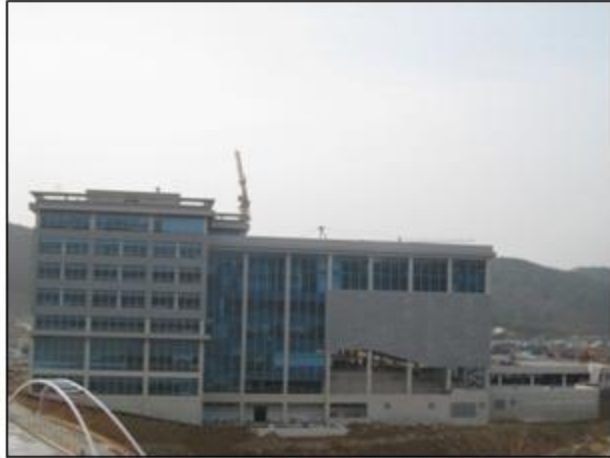
- 大学本部 全景