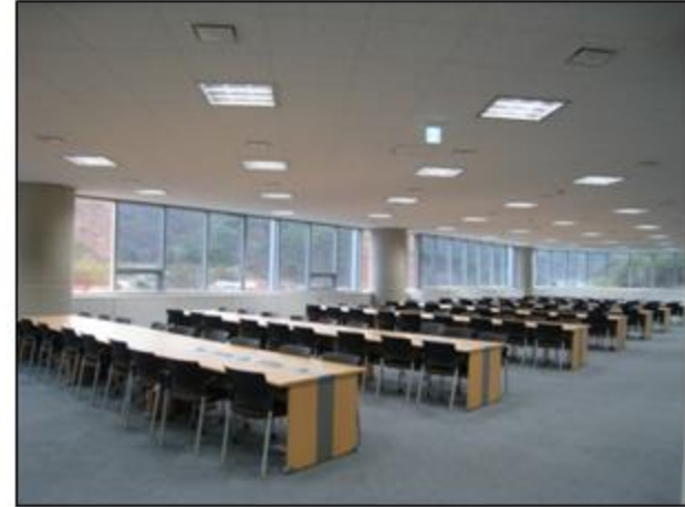
- 3層 閱覽室