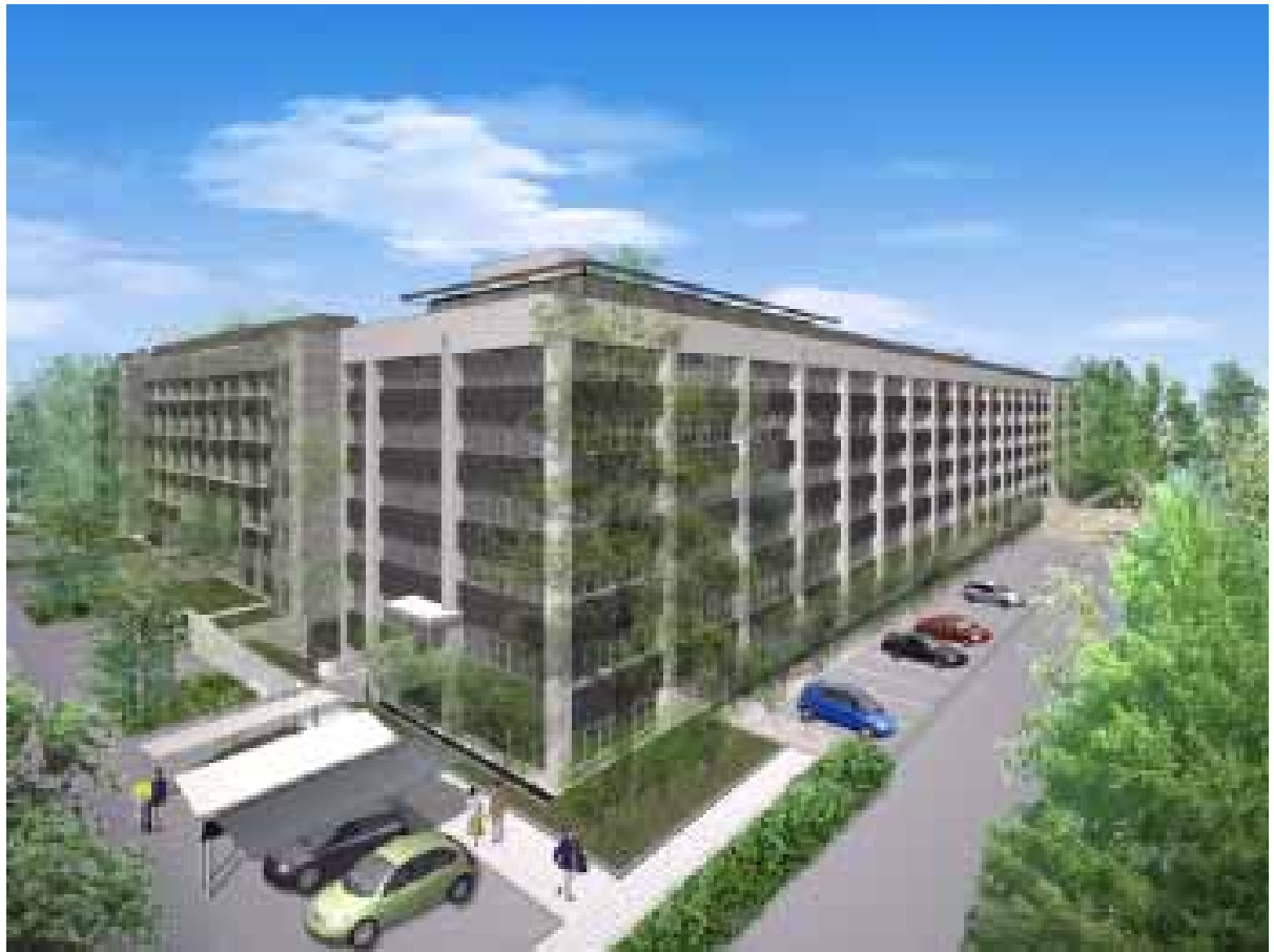
北東外観イメージ