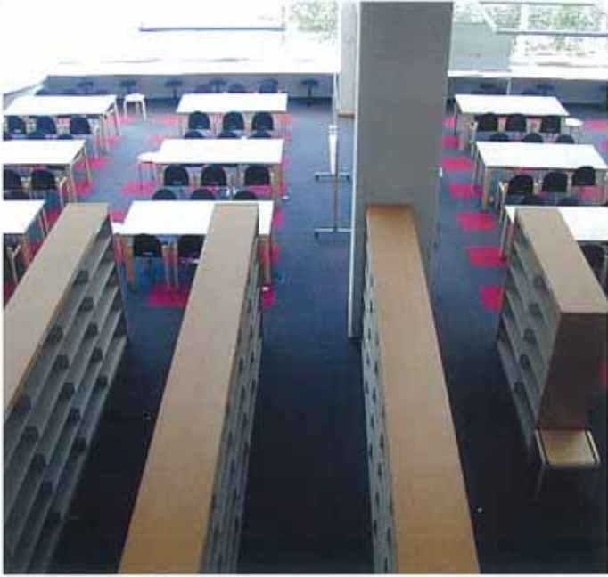
■ 学習情報センター