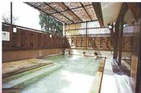
展望の湯 展望露天風呂