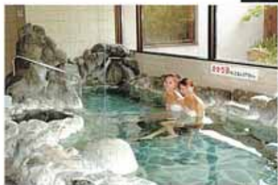
森の湯 自然石の大浴場