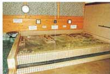
展望の湯 リラックスバス