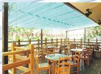
バーベキューテラス