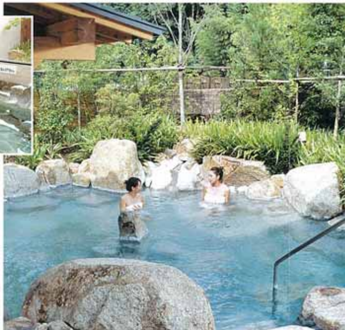
森の湯 大露天風呂