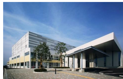
スポーツセンター 町立図書館