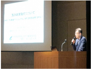
静岡市PPP/PFI地域プラットフォーム (国の政策動向について)