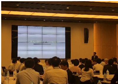
いしかわPPP/PFI地域プラットフォーム (羽咋駅周辺整備事業)