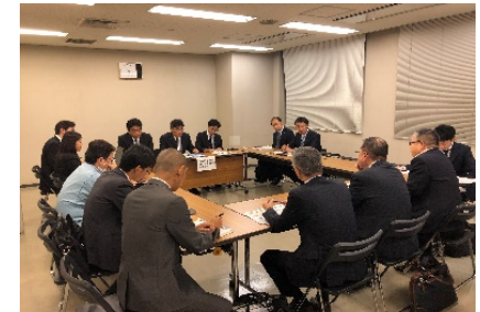
(個別案件のサウンディング状況) 川崎市PPPプラットフォーム