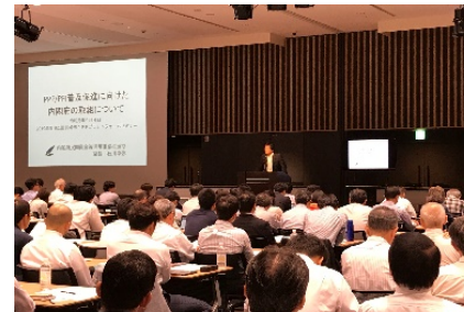
(国の施策に関する講演)