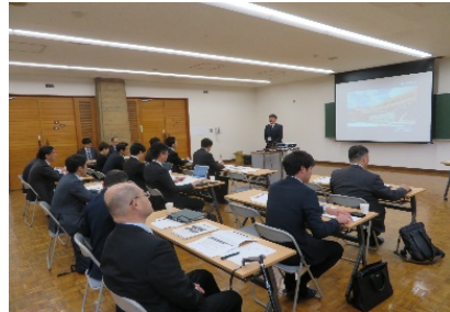
広島県PPP/PFI地域連携プラットフォーム (広島市三滝少年自然の家・ グリーンスポーツセンター改修事業)