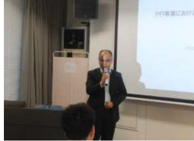
ぎふPPP/PFI推進フォーラム (PFI事業におけるファイナンスの考え方)