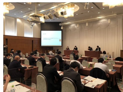
セミナーの開催 (かがわPPP/PFI地域プラットフォーム: 令和2年度支援)