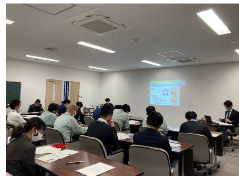
庁内勉強会における講義 豊明市(愛知県) (令和3年度支援)