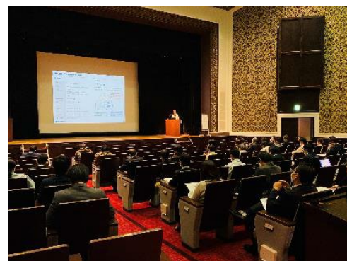
セミナーの開催 (群馬県PPP/PFIプラットフォーム: 令和3年度支援)