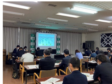
庁内勉強会における講義 若狭町(福井県) (令和3年度支援)