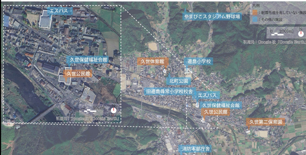
図1 対象施設の位置図

【施設の概要(現況)】 久世体育館(S49建築)、久世公民館(S45建築)、久世保健福祉会館(S60建築)、エスパスセンター(久世図書館)(H9建築)