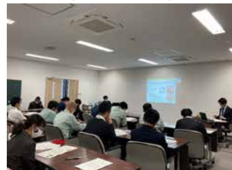
庁内勉強会における講義 豊明市(愛知県) (令和3年度支援)