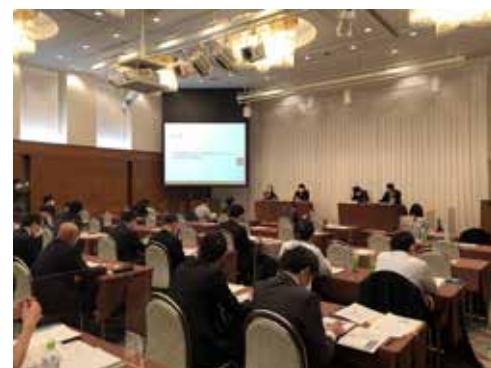
セミナーの開催 (かがわPPP/PFI地域プラットフォーム: 令和2年度支援)