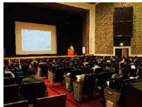
セミナーの開催 (群馬県PPP/PFIプラットフォーム: 令和3年度支援)