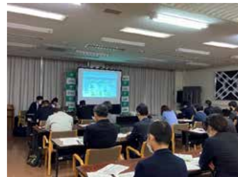
庁内勉強会における講義 若狭町(福井県) (令和3年度支援)