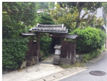
廃業した旅館をゲストハウスにリノベーション

対象事業：廃業旅館や遊休地を活用したリノベーション事業（泊食分離に対応した簡易宿泊所、外国人観光客等に対応したレストランなど）