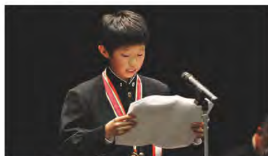
平成26年度作文最優秀賞朗読 (中学生部門)