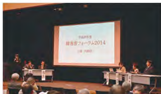
平成26年度「障害者週間」記念シンポジウム

平成28年4月から施行される「障害者差別解消法」についての概要説明に続き、パネルディスカッションでは、施行に向けての期待と課題について、議論を深めます。