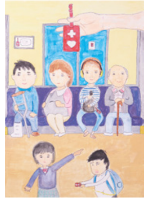
「ヘルプマークは 僕の声」