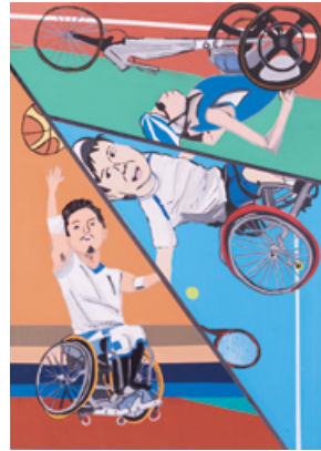
「1人ひとりが 輝く舞台」