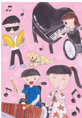
「だれでもいっしょに オーケストラ」