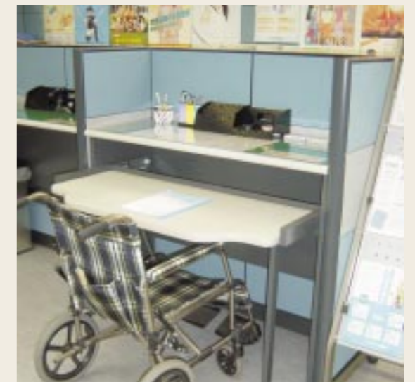
大田原社会保険事務所