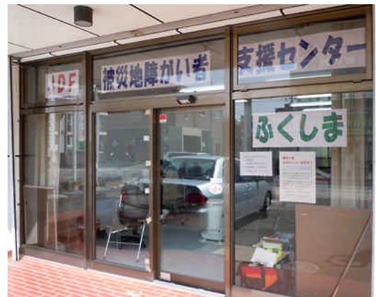
<ふくしまセンター事務所>

地震・津波・原発の事故、それによる風評被害と三重多重の災害を被っている福島県では、あいえるの会が中心となり活動を行っています。これまで、JDFの動員により、県内の避難所や障害者施設・事業所における障害者の状況調査が進められてきました。しかし、被災地に取り残されている在宅の障害者の安否確認はほとんど進んでいません。現在、「総合相談窓口」の開設、障害当事者が避難所