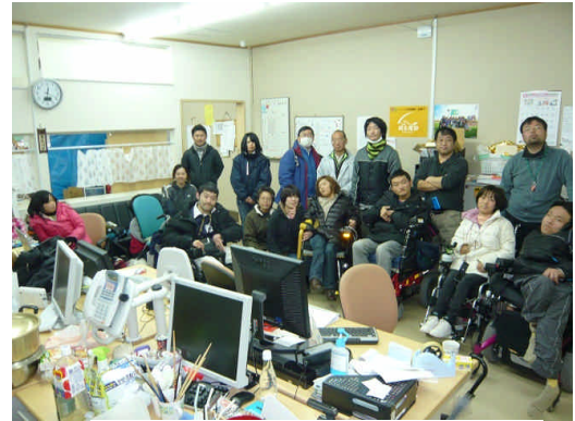
<みやぎ支援センターのメンバー>

その後、福島では日本障害フォーラム（JDF）東北関東大震災被災障害者総合支援本部との連携により、「JDF被災地障がい者支援センターふくしま」として様々な団体と協力しながら活動を広げています。また現在、岩手県盛岡市においてに3ヶ所目の被災地障害者センターの開所準備を進めています。