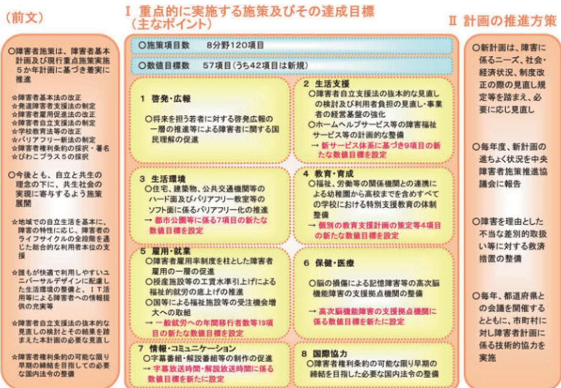
■ 図表1-43 重点施策実施5か年計画（平成20～24年度）（平成19年12月25日障害者施策推進本部決定）の構成（本文中では、「後期5か年計画」と記載）