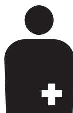
【オストメイトマーク】