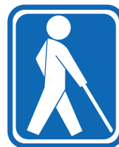
【盲人のための国際シンボルマーク】