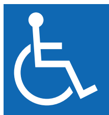
【障害者のための国際シンボルマーク】