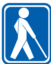
【盲人のための国際シンボルマーク】