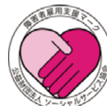
【障害者雇用支援マーク】