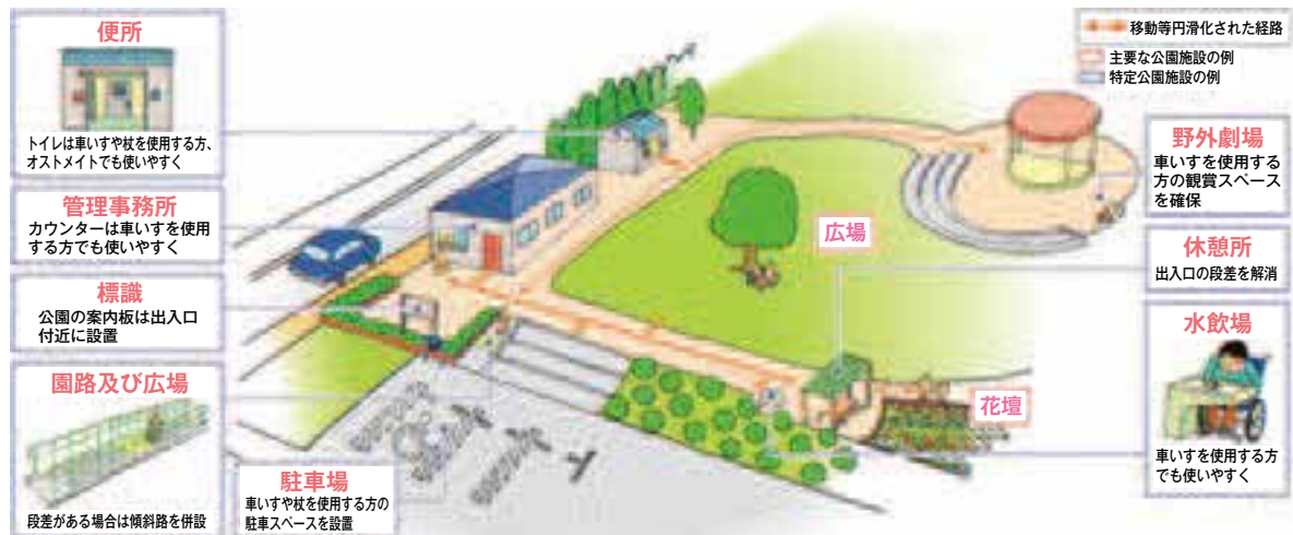
■ 図表7-9 「都市公園移動等円滑化基準」によってバリアフリー化した公園施設の例