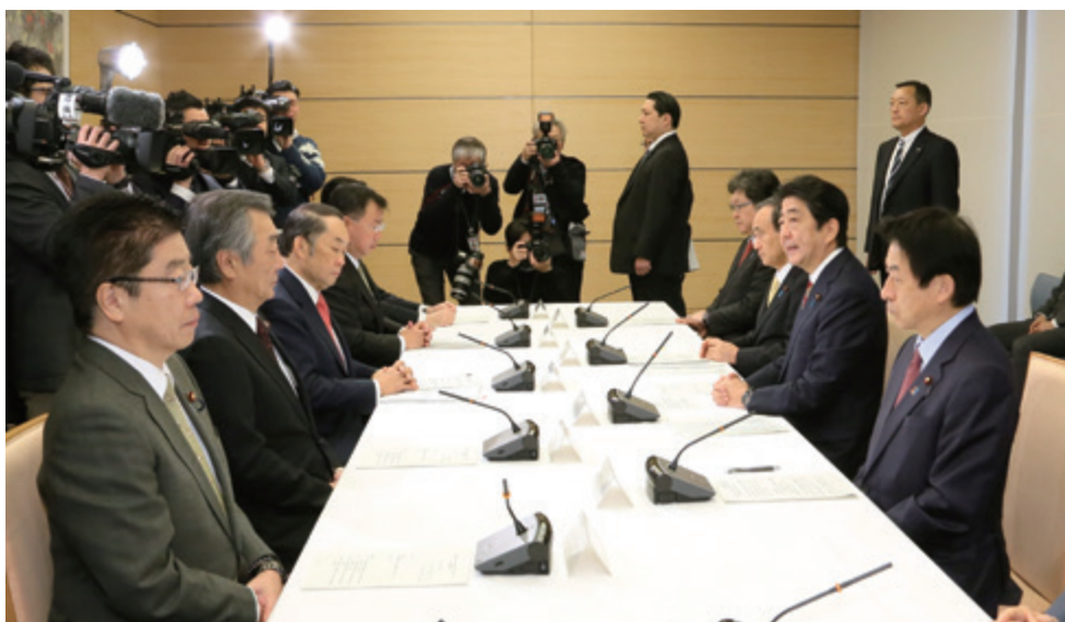
閣僚会議の様子（平成28年12月8日）

事件後、事実関係の徹底した検証と、それを踏まえた再発防止策を関係省庁一丸となって検討するため、政府は、厚生労働省を中心に、9名の構成員に加え、内閣府、警察庁、法務省、文部科学省のほか、神奈川県、相模原市といった関係自治体も参加した検討チームを平成28年8月に設置した。検討チームでは、その時点で把握された事実関係に基づく検証を行うとともに、関係団体等からの意見聴取を実施し、同様の事件が二度と発生しないよう、精神保健医療福祉等に係る現行制度に加え、いかなる新たな政策や制度が必要なのか、更には、いかなる社会を新たに実現していくことが必要なのかという観点から、計8回の会議を開催し、事実関係に基づく検証結果を中間とりまとめとして同年9月14日に、事件に関する再発防止策を報告書として12月8日に、それぞれ公表した。この翌日に開催された閣僚会議では、当該報告書の内容について報告されるとともに、再発防止策を実効性あるものとするため、関係府省庁で連携して具体的な取組を進めることについて確認された。