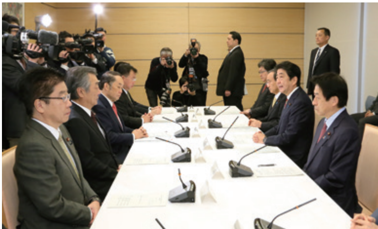
閣僚会議の様子（平成28年12月8日）

また、ここで明らかとなった課題等に対応するため、措置入院者が退院後に医療等の継続的な支援を確実に受けられるよう所要の措置を講ずること等を内容とする「精神保健及び精神障害者福祉に関する法律の一部を改正する法律案」が平成29年2月28日に閣議決定され、第193回国会に提出された（法律案の概要については、図表1-1）。