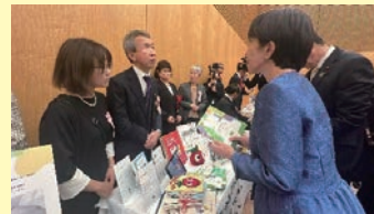
バリアフリー・ユニバーサルデザイン推進功労者表彰式における展示の様子