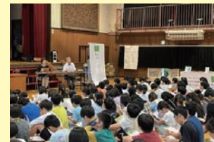
埼玉県八潮市大瀬小学校での出前授業の様子