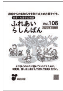
点字・大活字広報誌「ふれあいらしんばん」