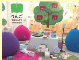
「りんごプロジェクト」のイベントでの展示・体験会の様子

出前授業では、小・中・高校や特別支援学校において、「読書のバリアフリーとは？」をテーマに、読書の多様性を学ぶ授業を実施しており、実施校の学校図書館における「りんごの棚」の新設につながった事例もある。知的障害者が通う特別支援学校での出前授業に参加した生徒からは、「字が大きくて読みやすい本があることを初めて知った」「写真が多くわかりやすかった」といった感想が聞かれるなど、自分に合ったアクセシブルな書籍等があることを初めて知り、興味を持つ様子が見られた。