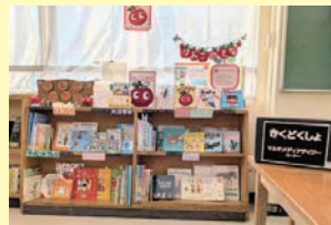
神奈川県横浜市立大道小学校に設置されている「りんごの棚」