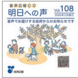
音声広報CD「明日への声」 資料：内閣府