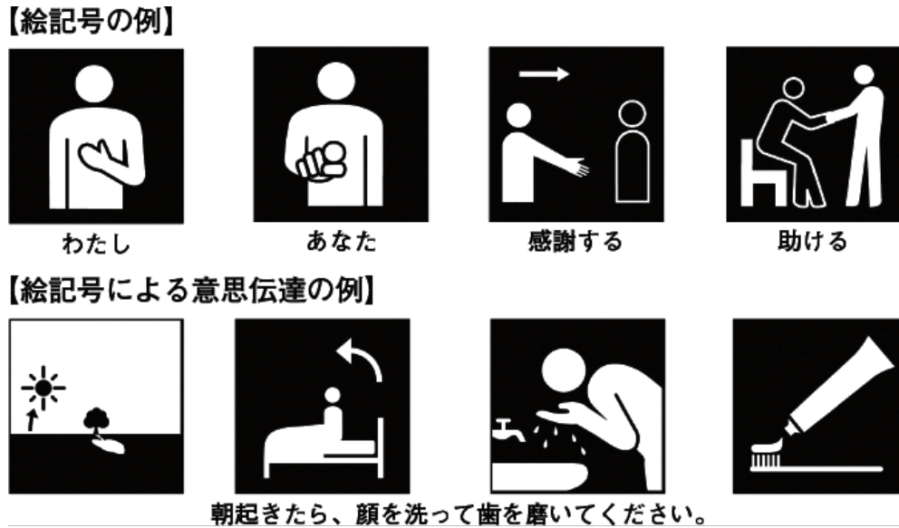
■ 図表5-13 コミュニケーション支援用絵記号の例

注：コミュニケーション支援用絵記号デザイン原則（JIS T0103）には参考として約300の絵記号の例を収載しており、これらは公益財団法人共用品推進機構のホームページから無償でダウンロードすることができる。