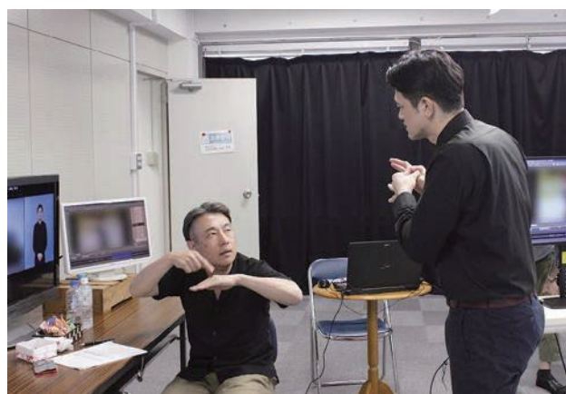
聴覚障害者情報提供施設(聴力障害者情報文化センター): 手話入り映像の撮影

厚生労働省では、聴覚障害のある人のために、字幕(手話)入り映像ライブラリーや手話普及のための教材の制作・貸出し、手話通訳者等の派遣、情報機器の貸出し等を行う聴覚障害者情報提供施設について、ICTの発展に伴うニーズの変化も踏まえつつ、その支援を促進している。