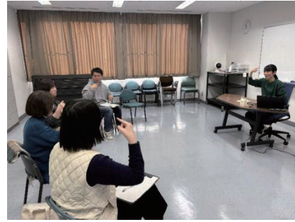
国立障害者リハビリテーションセンター学院における手話通訳士の養成の様子