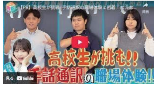
意思疎通支援従事者の確保事業