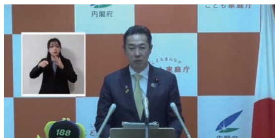
黄川田内閣府特命担当大臣の定例会見の様子