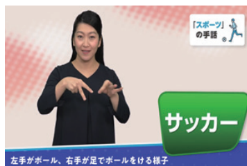
左：手話の理解を深めるためのパネル